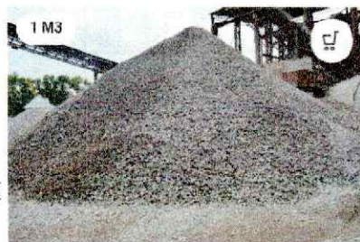
Щебінь гранітний фракції 25-60 мм.