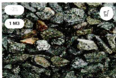
Щебінь гранітний фракції 20-40 мм