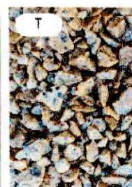
Щебінь гранітний д (чер

✓ Є в наявності 1 000,00 грн. 850,00 грн.